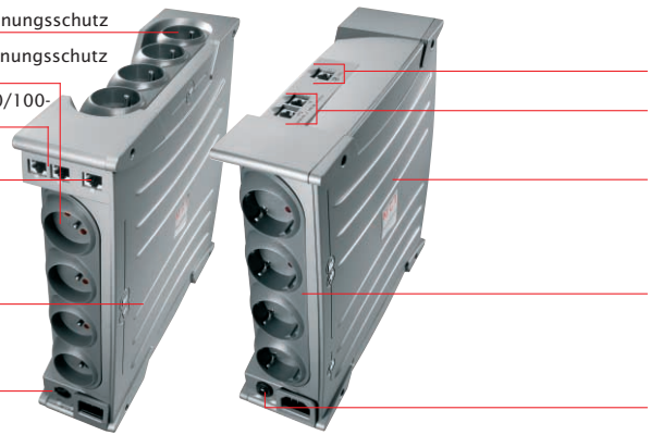
Ellipse ASR 1000/1500