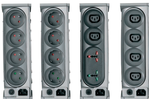
FR DIN UNI IEC