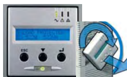
Mehrsprachiges, drehbares Display.