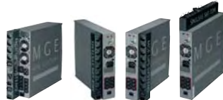
Zahlreiche Installationsmöglichkeiten für FlexPDU und HotSwap MBP.