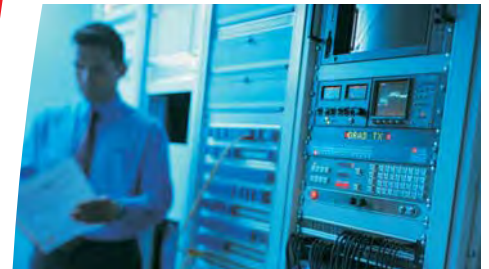
Server, Datenspeicher und Netzwerkkomponenten.