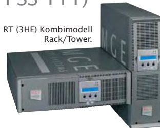
RT (3HE) Kombimodell Rack/Tower.