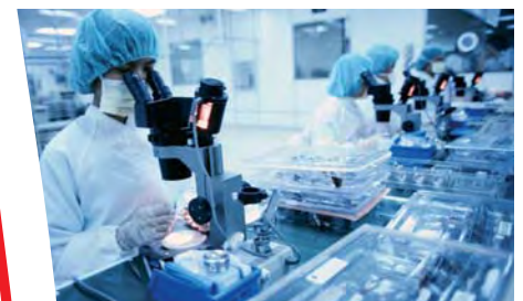
Medizintechnik - industrielle Anwendungen.