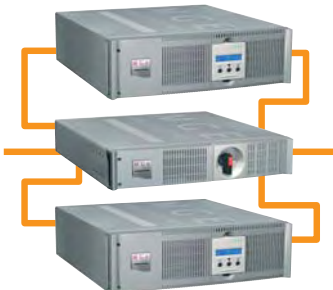
Pulsar M und ModularEasy-Kit.