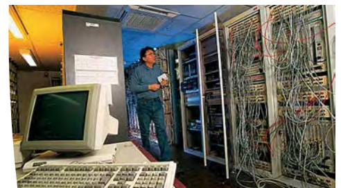
Telefonanlagen - VOIP