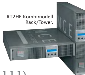
RT2HE Kombimodell Rack/Tower.